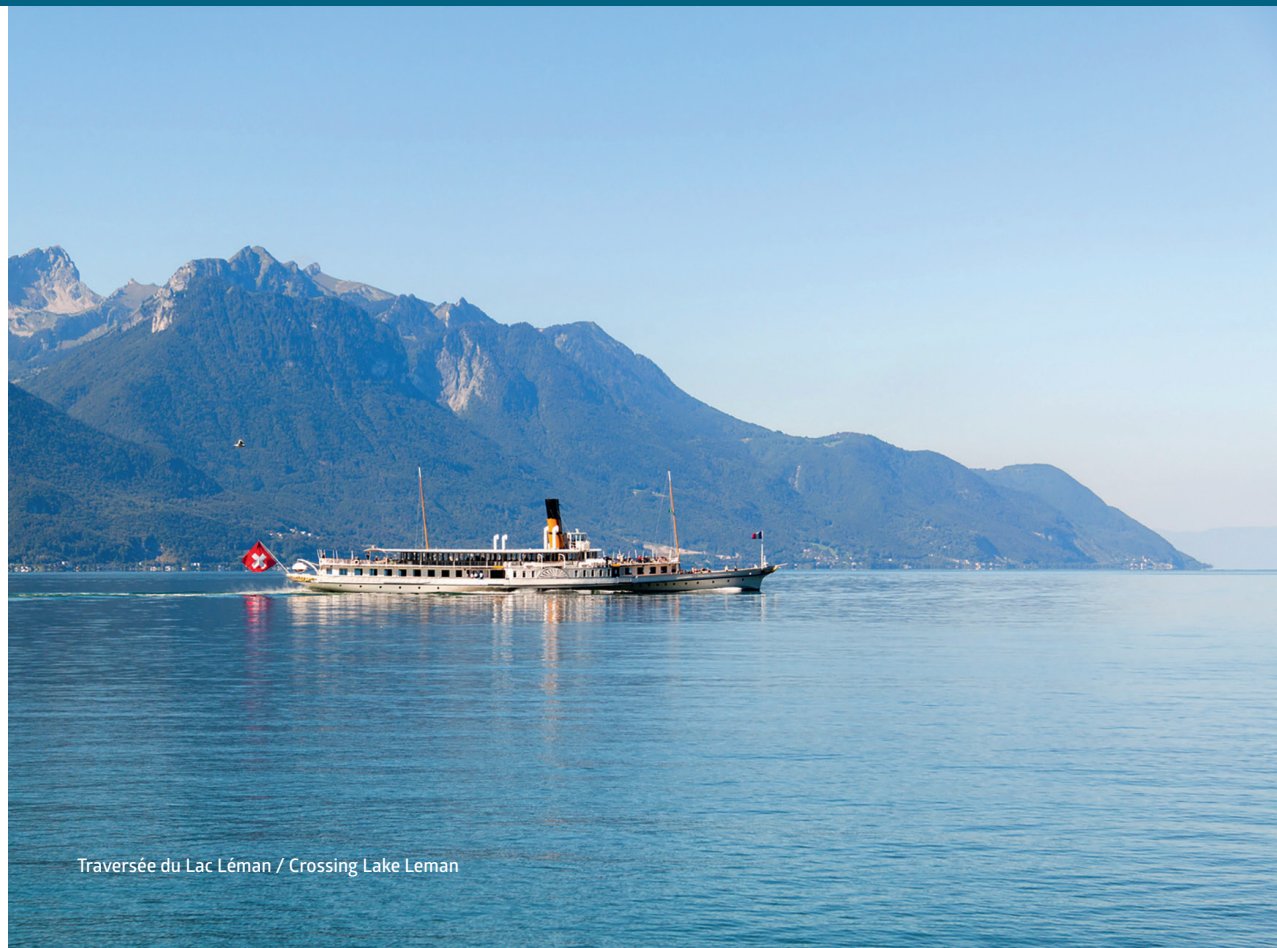
Traversée du Lac Léman / Crossing Lake Lemman

On the edge of the city of Evian, close to Geneva and Lausanne, Maxilly-sur-Léman enables you to combine a fulfilled family life with high professional requirements.