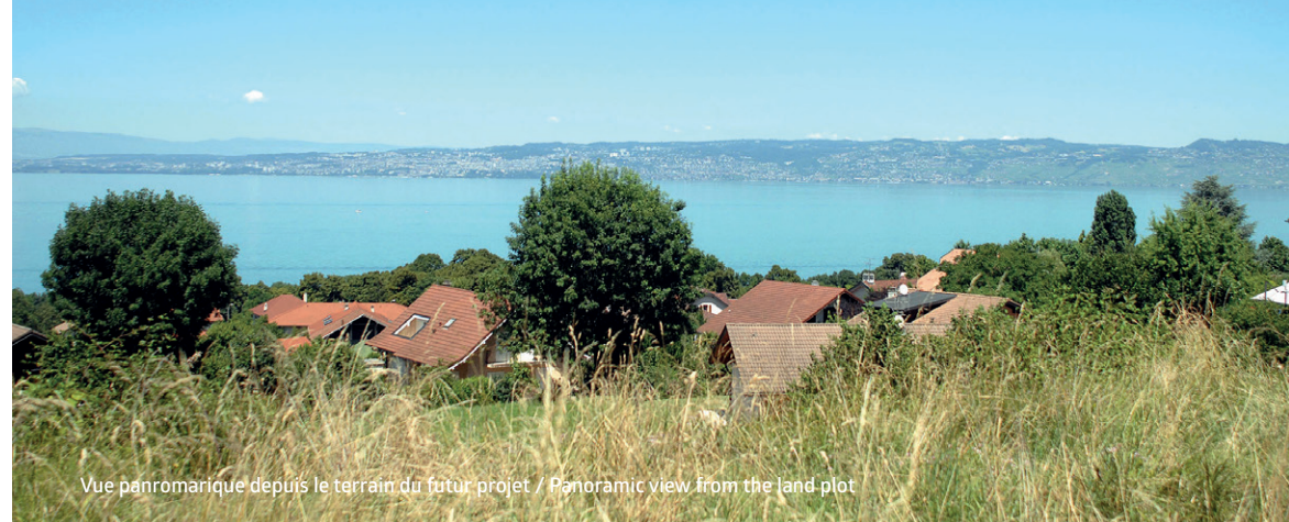
Vue panoramique depuis le terrain du futur projet / Panoramic view from the land plot

Designed as houses, the apartments offer spacious and comfortable interiors opening on deep terraces or private gardens. With a stunning view on the Lake and on the Valais vineyards, with the majestic Alpine peaks far away, these outdoors spaces offer the privilege of inside outside living with full privacy. To add to the quietness of the location, Grand Large is free from the traffic noise as vehicles are stored in a dedicated parking area.