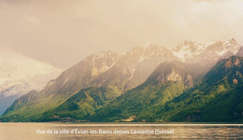
Vue de la ville d'Évian-les-Bains depuis Lausanne (Suisse)